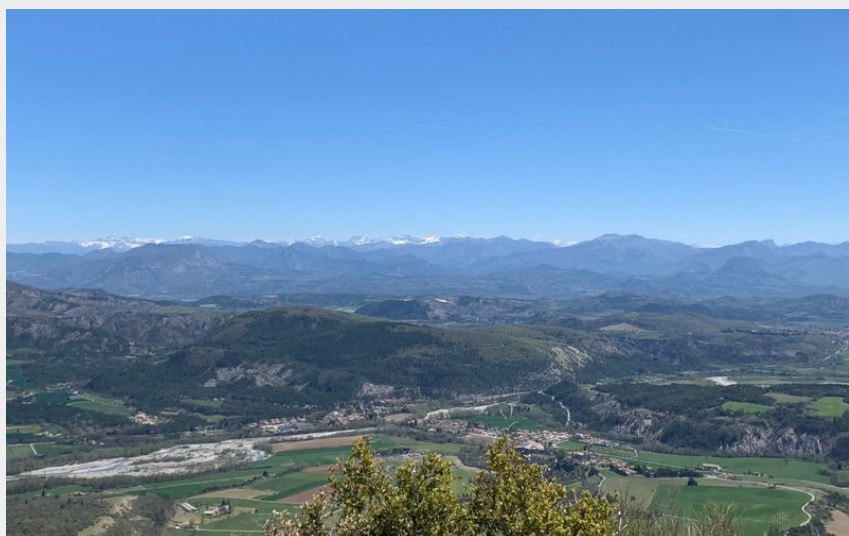
Panorama depuis la pointe du Col de Garde