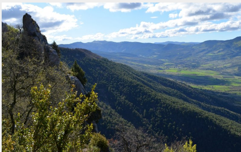
La Montagne du Croc depuis la Grotte de l'Ours (Pauline Amberg - PNR des Baronnie Provençales)