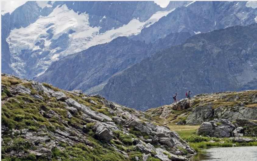
Lac Lérié