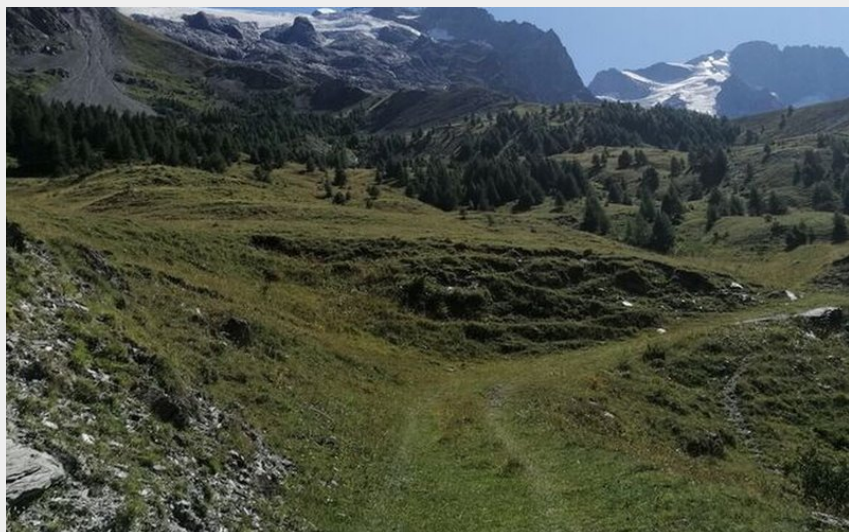
La vue sur le glacier du Tabuchet et la Meije depuis le départ du chemin