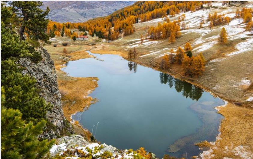
Lac des Chiens (©Thibaut Blais)