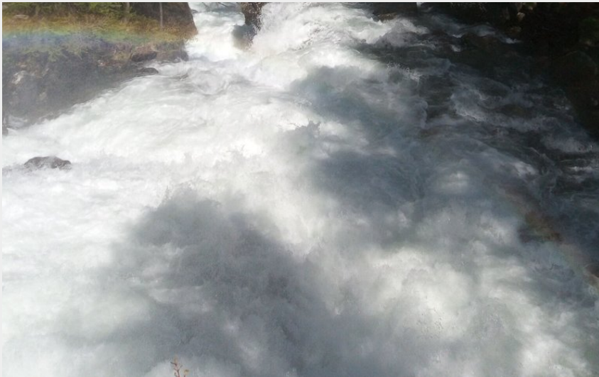
Cascade de Débaret