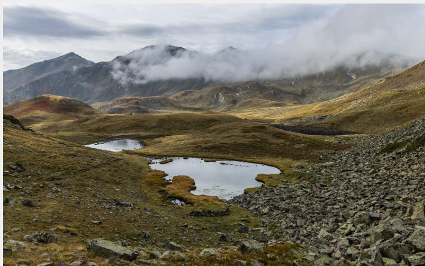
Col du Chardonnet