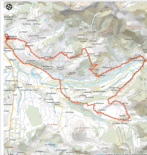
Bocages du champsaur à vélo

Partez de Saint-Bonnet-en-Champsaur et laissez-vous séduire par le parcours des Bocages du Champsaur, une boucle vallonnée entre hameaux charmants, prairies alpines et petites routes sinueuses.