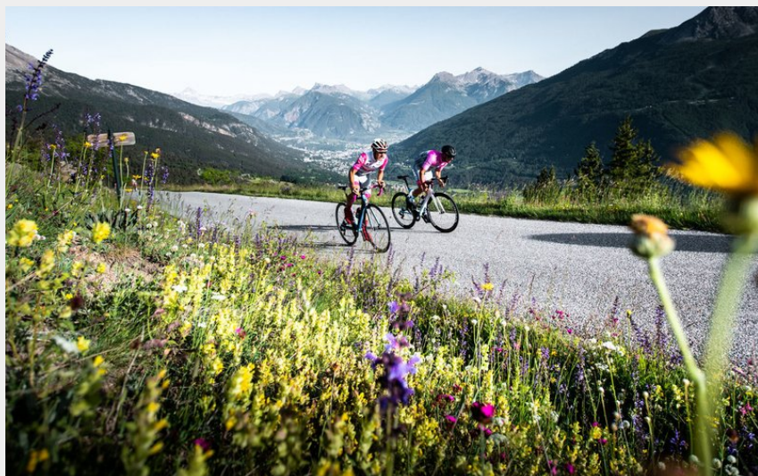
Ascension du col du Granon