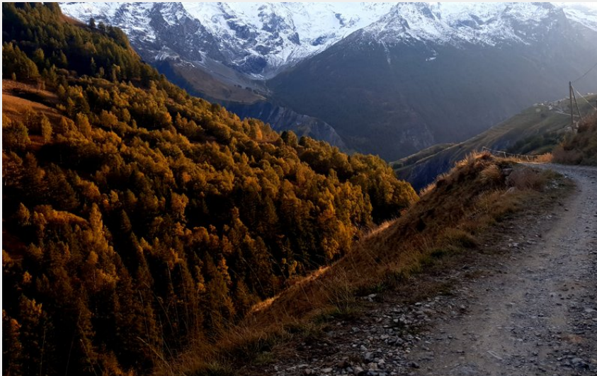
En direction de Valfroide