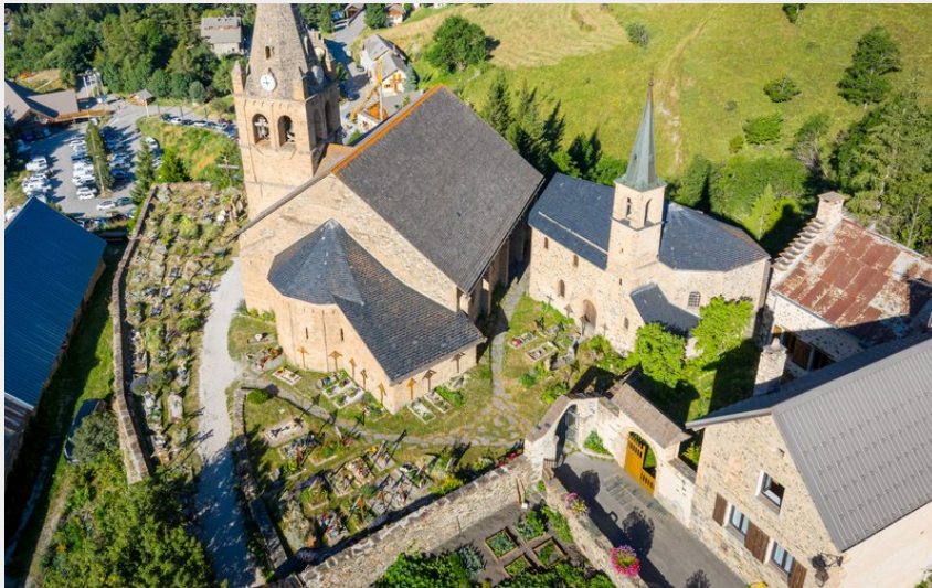
La Grave village