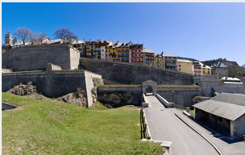
Centre historique de Briançon