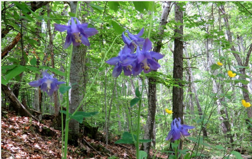
Ancolies sauvages (CDRP05)