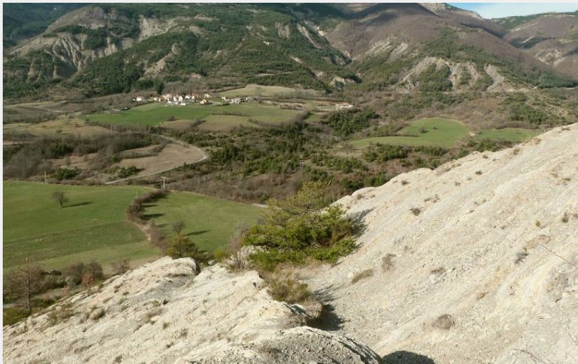
En direction du col de la Beume... (CDRP05)