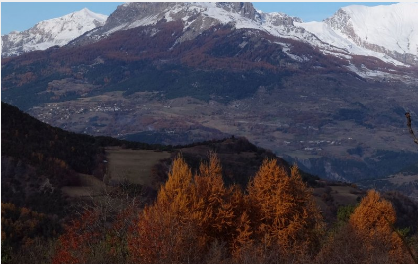
Les Aiguilles de Chabrières en arrière plan (CDRP05)