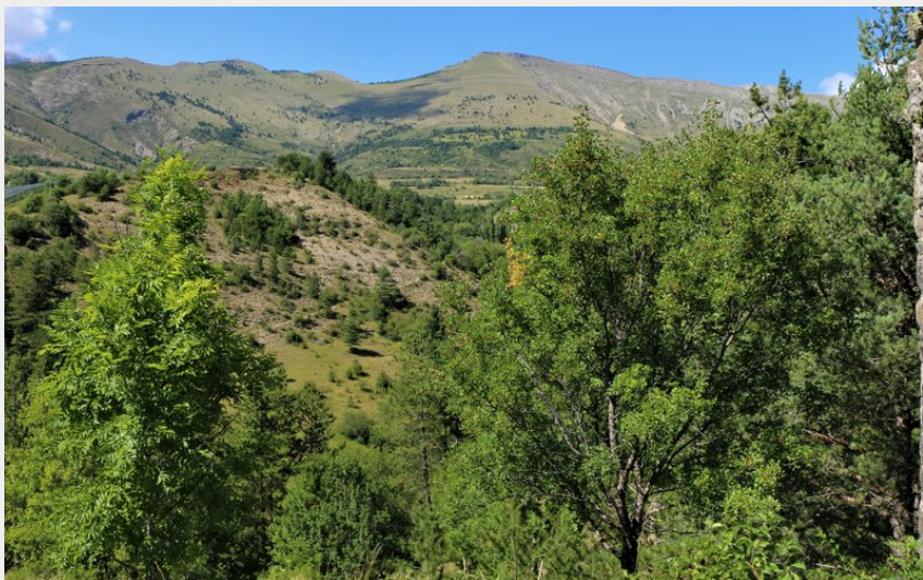
Au dessus de la Roche des Arnauds