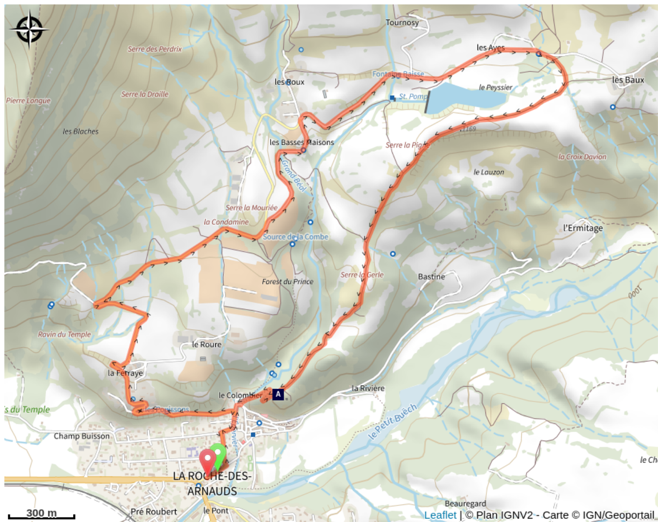
Château de la Roche des Arnauds (A)