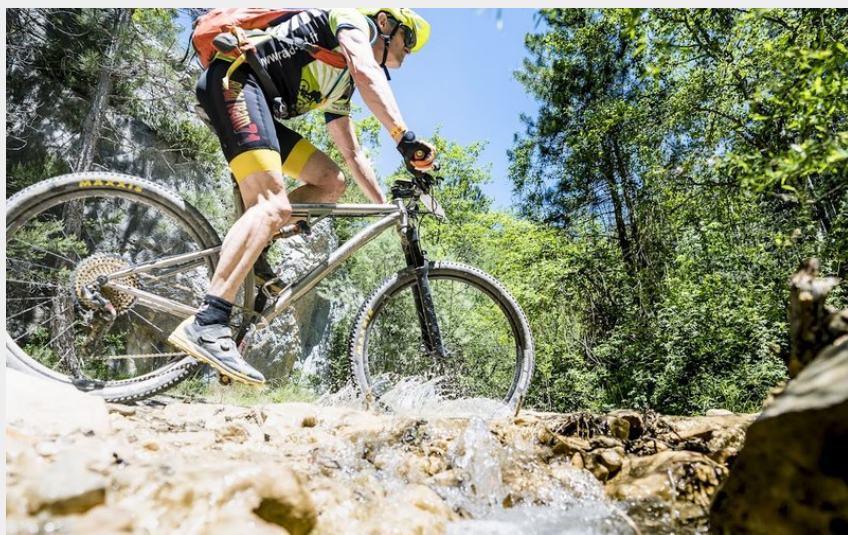
Sur les rives du petit Buëch