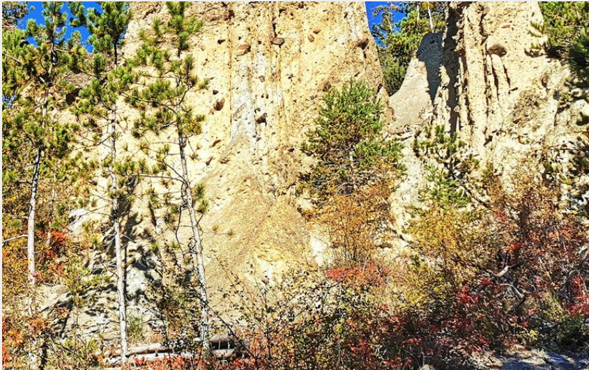
les demoiselles coiffées (c. baulet)