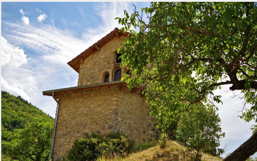
Église de Saint-Auban-d'Oze (Norman Lancelot)

Parc Naturel Régional des Baronnies Provençales - Saint-Auban-d'Oze