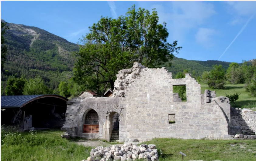
Abbaye de Clausonne - façade nord (Les Amis de Clausonne)