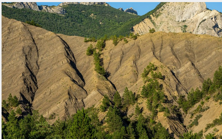
Marnes au col de la Croix (Rémi Borel)

Parc Naturel Régional des Baronnies Provençales - Savournon