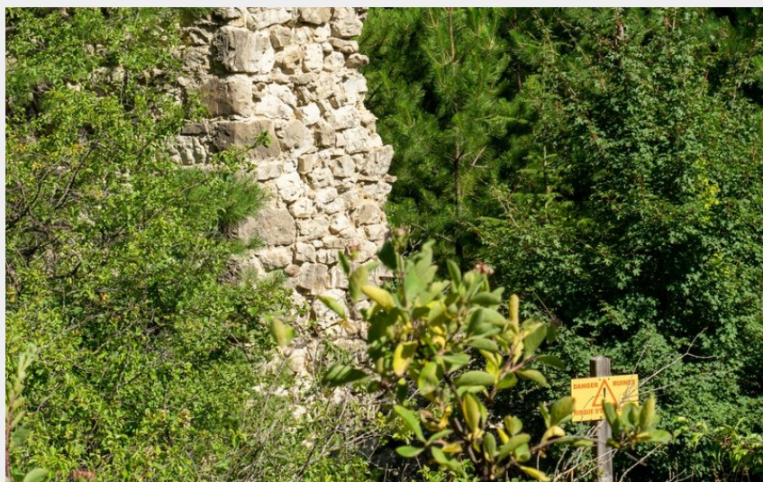
Ancien hameau de Piloubeau (Rémi Borel)