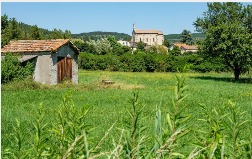
Église Saint-Michel de Barret-sur-Méouge (Rémi Borel)

Parc Naturel Régional des Baronnies Provençales - Val Buëch-Méouge