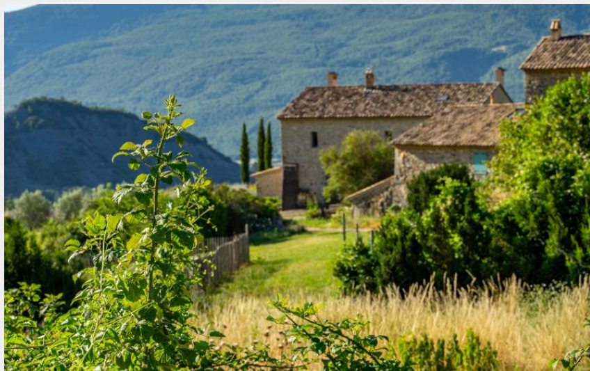
Bevons - La Fontaine (Rémi Borel)