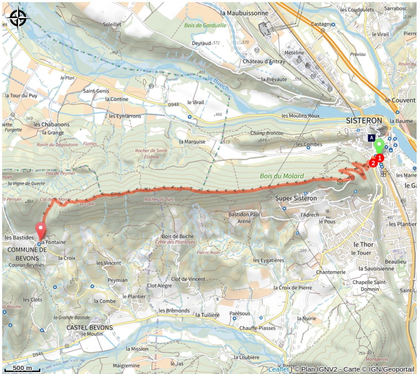
La Citadelle de Sisteron (A)