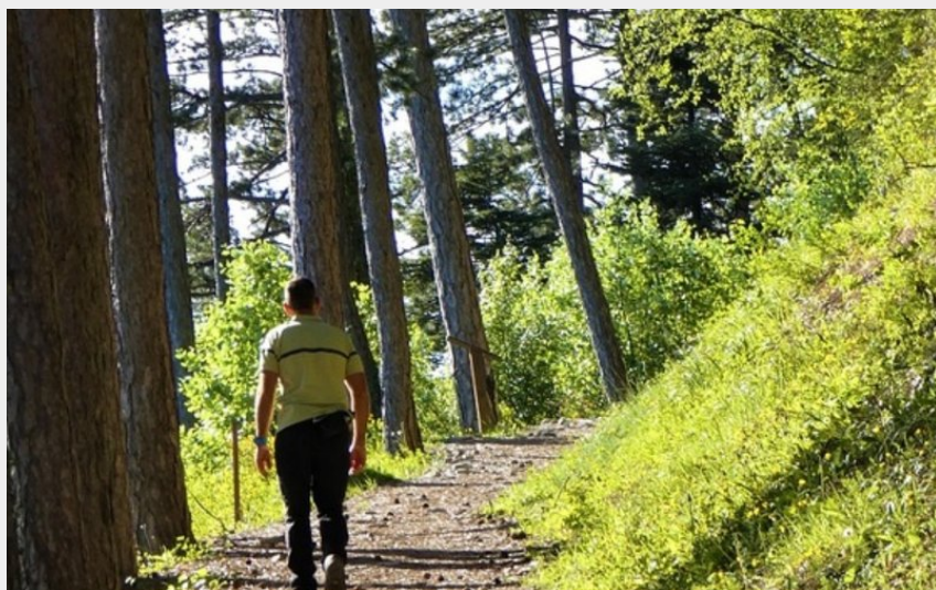
Montagne du Molard (OT Sisteronnais Buëch)