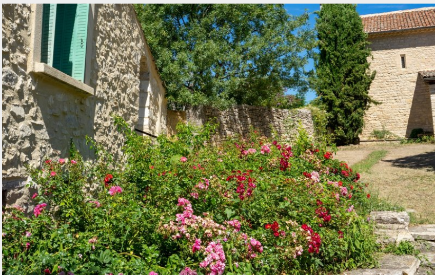
Église Saint-Pierre de Fontienne (Rémi Borel)