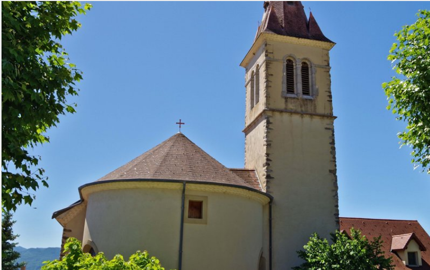
Église de Sigoyer (Norman Lancelot)