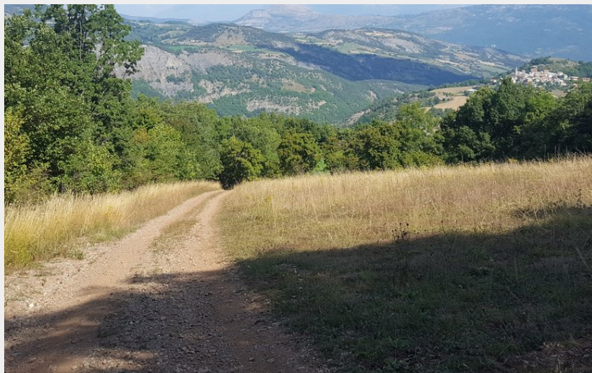
Entre Valsерres et Chorges (Joelle Noguier)