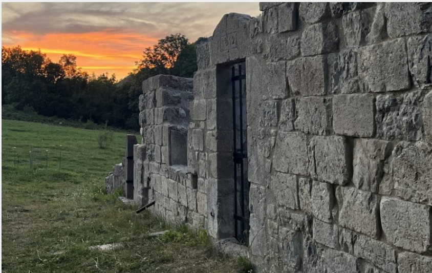
Abbaye de Clausonne (Rémi Borel)