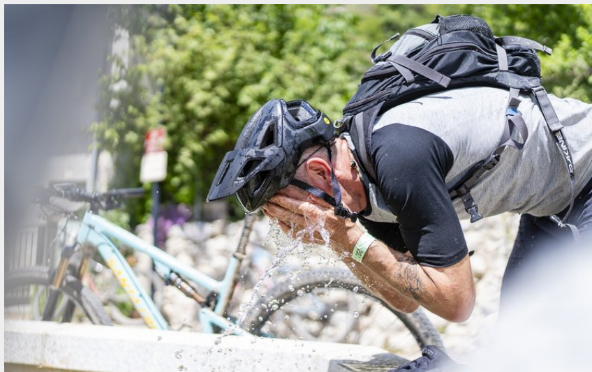
Fontaine de Montmaur