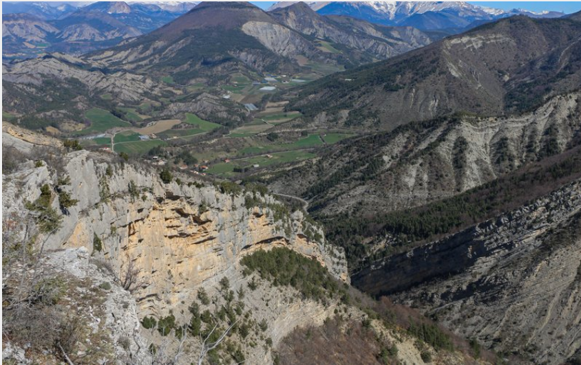
Site majestueux du Gouravour

Parc Naturel Régional des Baronnies Provençales - Le Saix