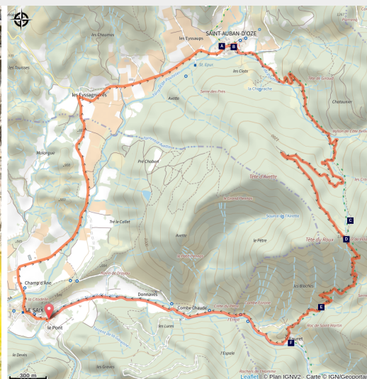
VTT printanniers Buëch

Une montée facile sur piste et une descente technique réservée aux vttistes expérimentés.