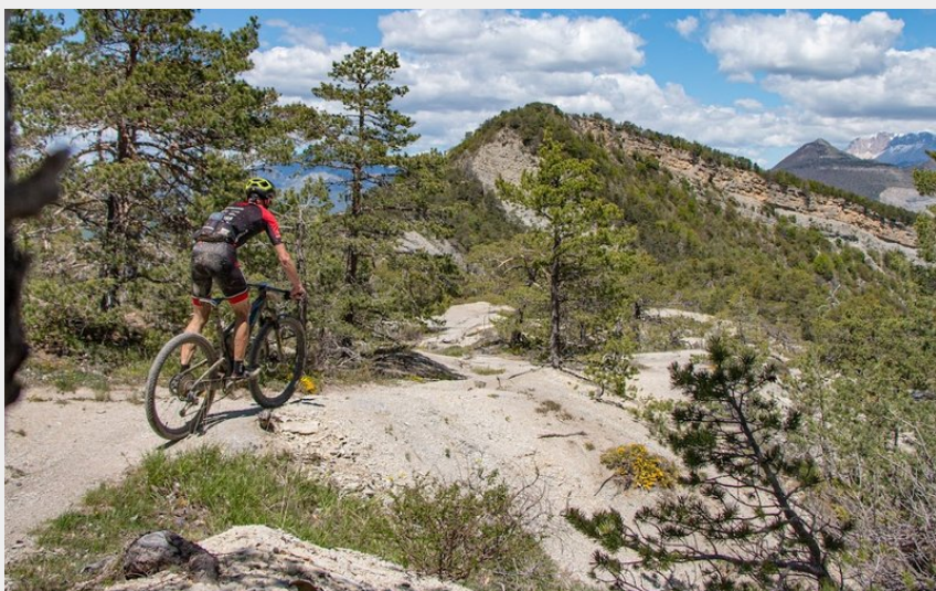
Sentier majeur sur les hauteurs du Saix (Damien Desbenoit)