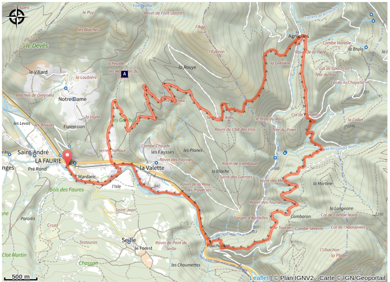
Les marmites du Diable (A)