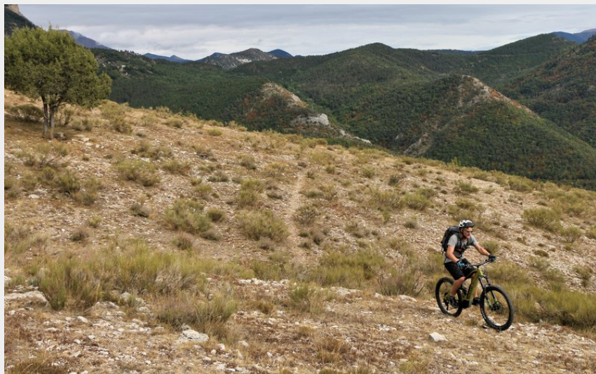
Sentier en balcon au dessus des gorges d'Agnielles