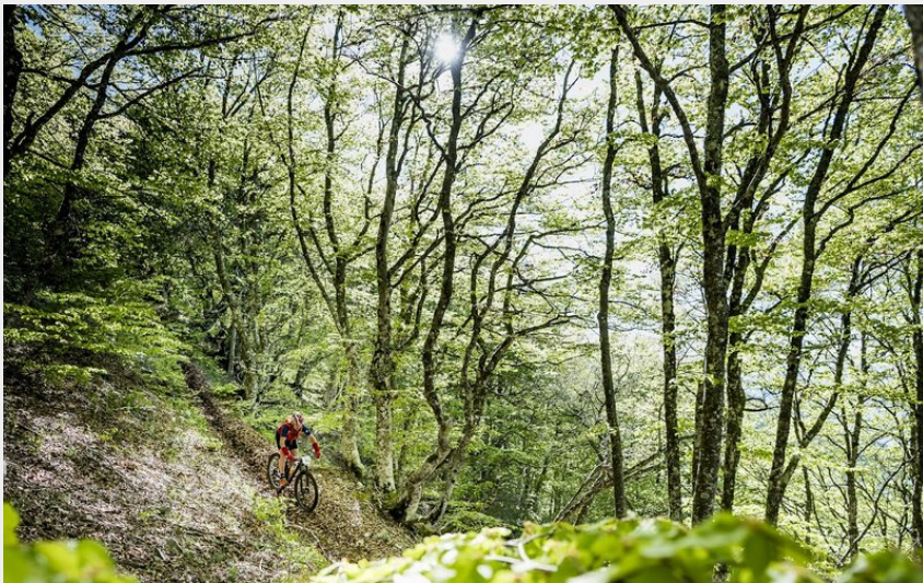
VTT au coeur de la hêtraie de Bane