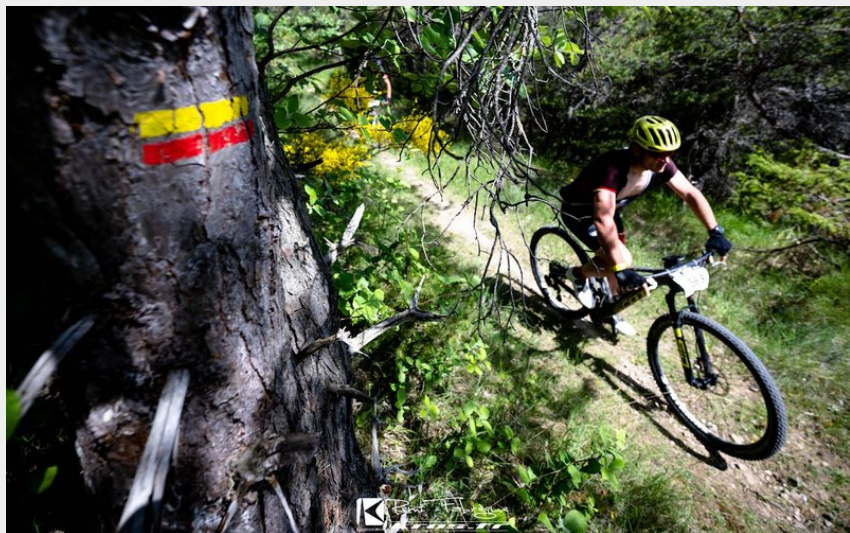
VTT Buëch