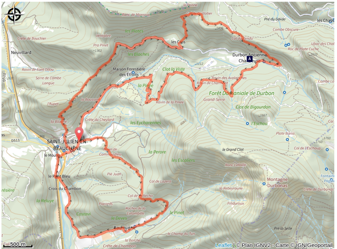
Ancienne Chartreuse de Durbon (A)