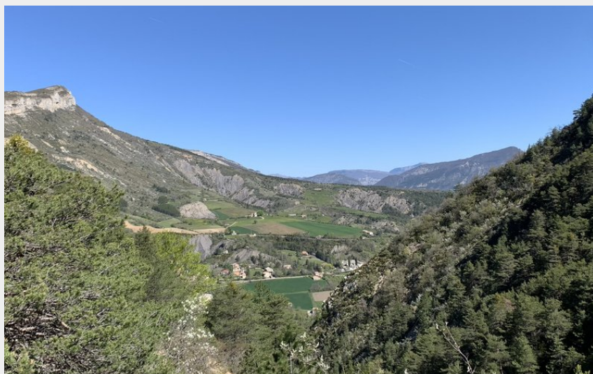
Vue depuis la montée au col de Garde