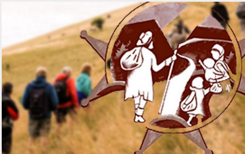
Histoire et culture Huguenotes