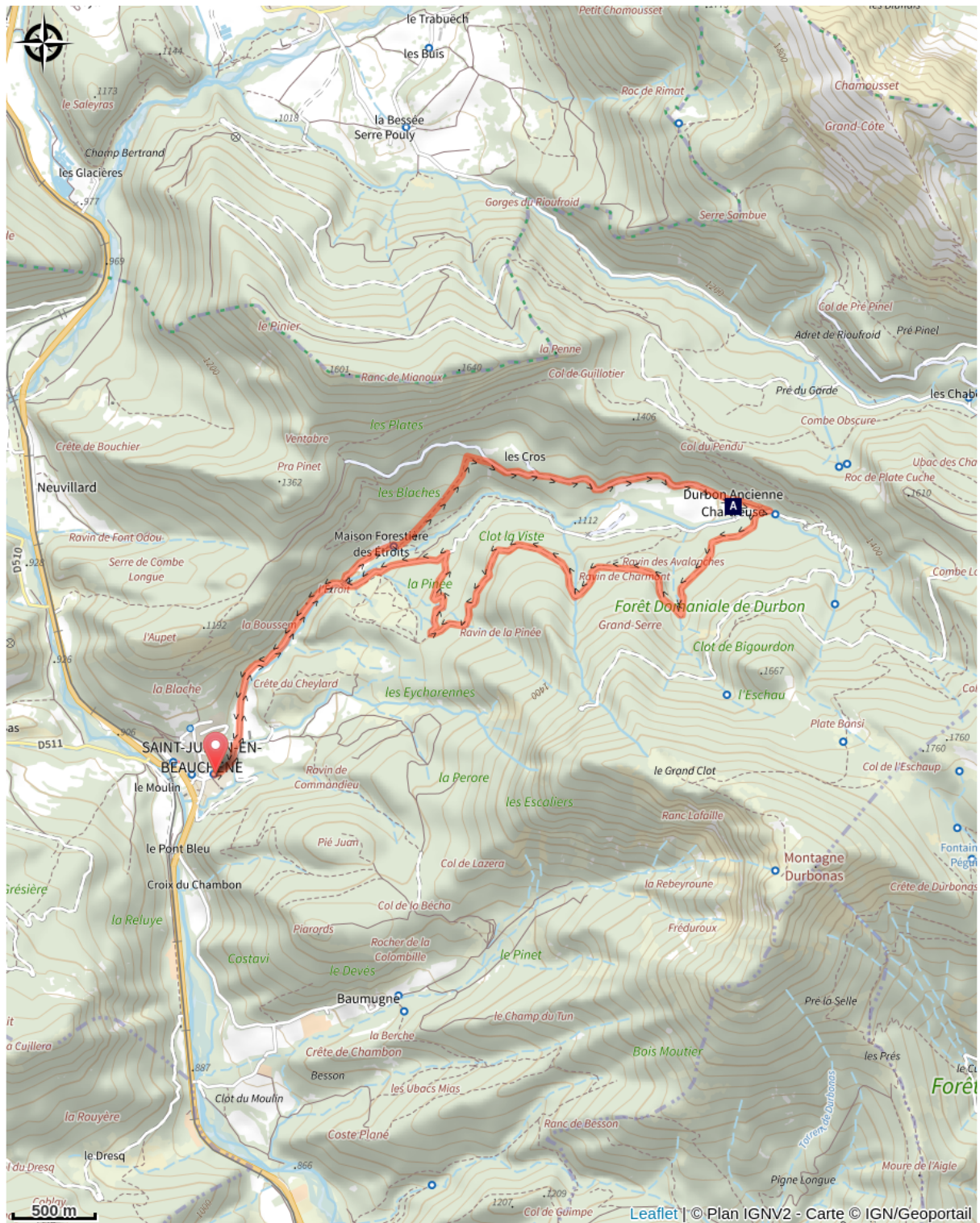
Ancienne Chartreuse de Durbon (A)