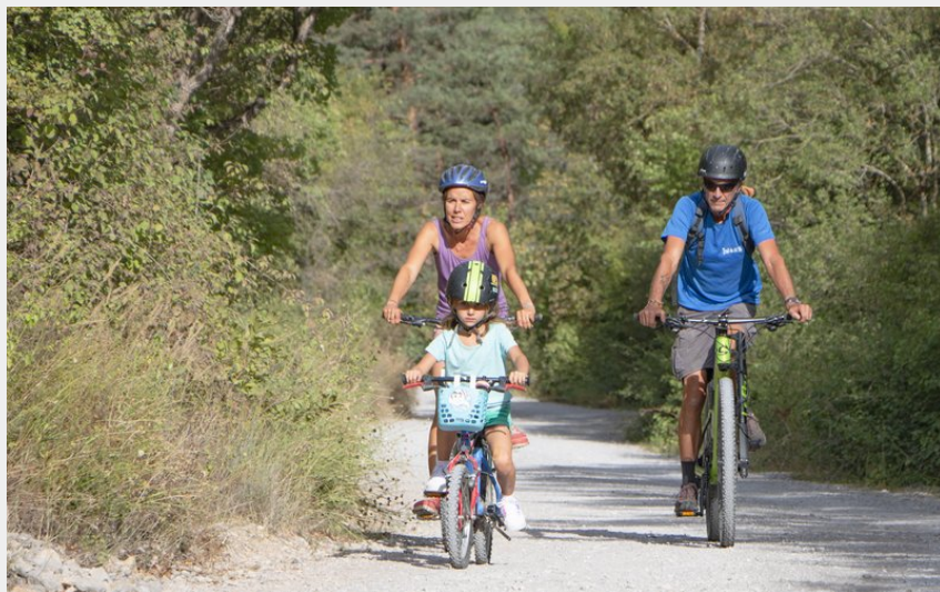
Sur les pistes du Buëch en famille