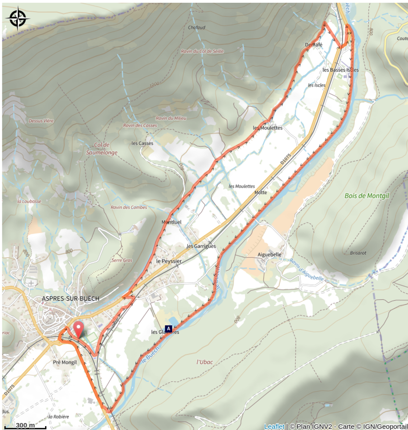
Anciennes glacières (A)