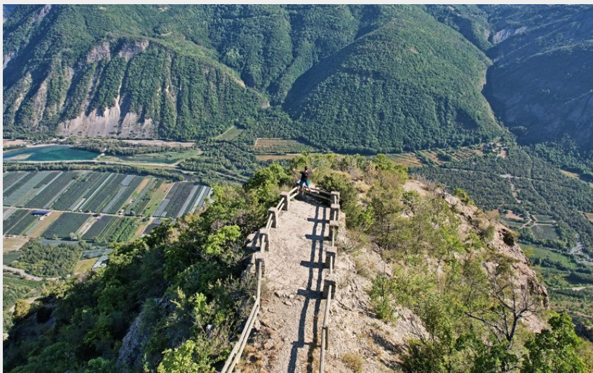
Belvédère de la Montagne Saint-Maurice (N. LANCELOT)