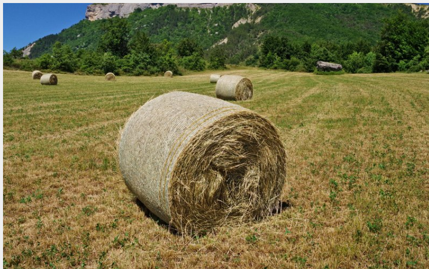
Petit Cèuse (N. LANCELOT)