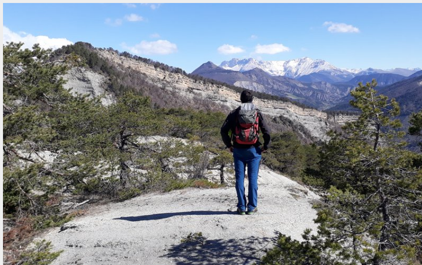
Montagne d'Oule et massif du Dévoluy depuis Tré Maroua (J. NOGUER)