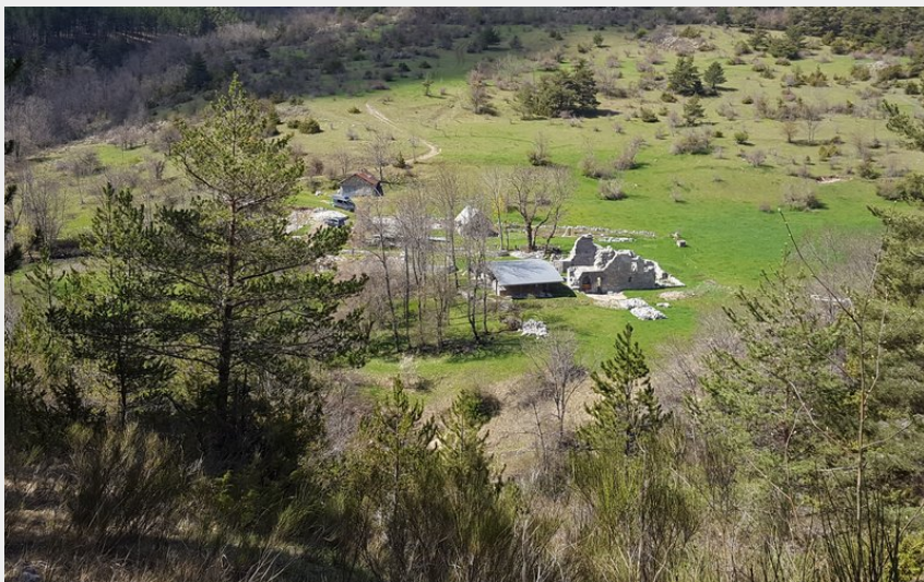
Vestiges de l'abbaye de Clausonne (J. NOGUER)