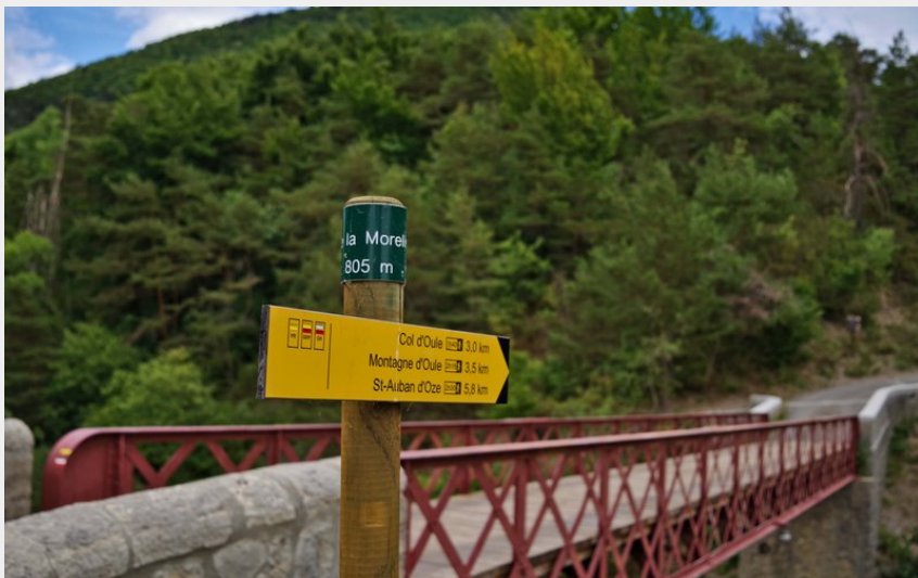
Le Pont de la Morelle sur le Petit Buëch (N. LANCELOT)