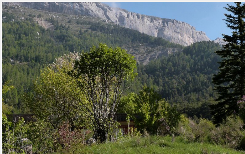
La Montagne de Céüse et ses falaises (CDRP05)