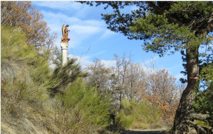
La statue de l'Ange à proximité du col (CDRP05)