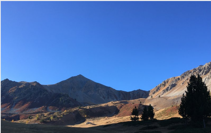
Alpage autour du Col des Ayes (CDRP05)