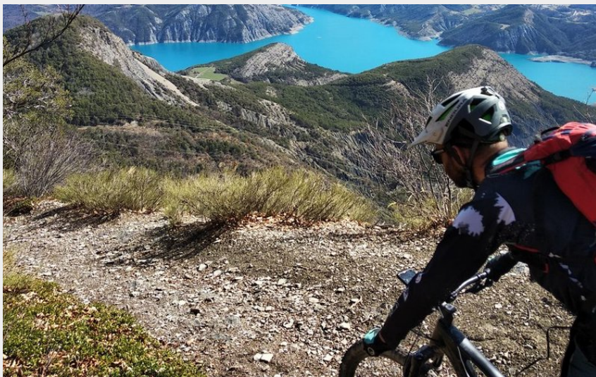
Vue sur le Sauze-du-Lac depuis les hauteurs de Rousset (Parc national des Ecrins - Emmanuel Danjou)