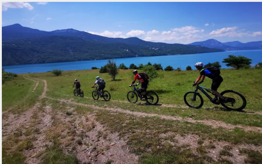
Retour au point de départ (Parc national Ecrins - E-Pedal)